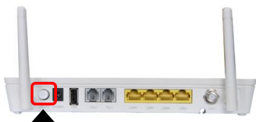
Power on-off button